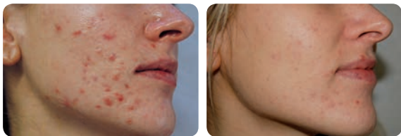
Akne - Vor und nach 3 Behandlungen