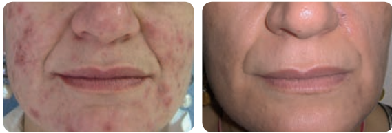
Akne - Vor und nach 1 Behandlung