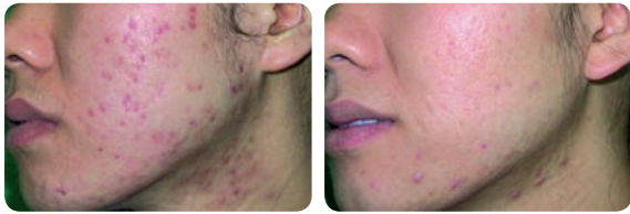
Akne - Vor und nach 1 Behandlung