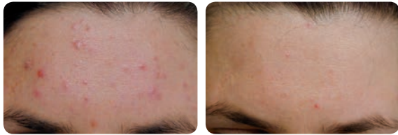
Akne - Vor und nach 3 Behandlungen