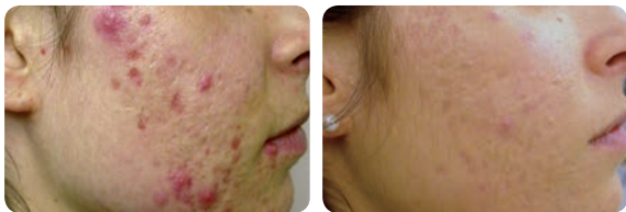
Akne - Vor und nach 5 Behandlungen